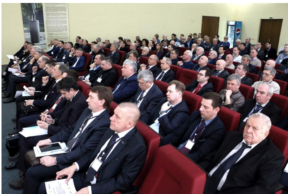
Участники конференции в актовом зале ЛИИ им. М.М. Громова

Основной целью мероприятия было обобщение и анализ результатов исследования проблем предотвращения авиационных происшествий, связанных с потерей управления в полете, а также обсуждение предложений по подготовке летного состава при попадании в сложное пространственное положение, сваливании и выводу из него.