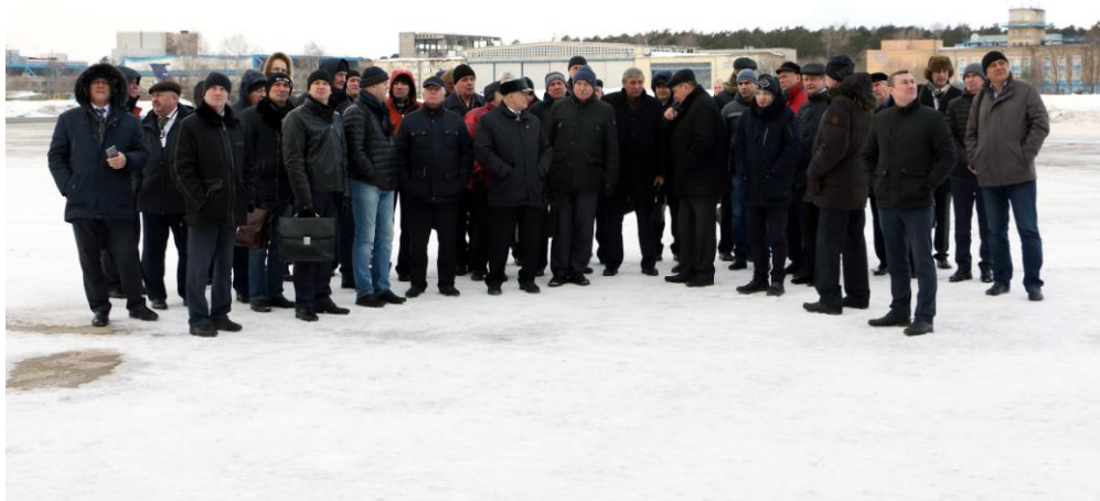
Участники конференции на летном поле ЛИИ

Участники и организаторы конференции высоко оценили эффективность встречи, подчеркнули важность поднятой проблемы и необходимость поиска путей ее решения.